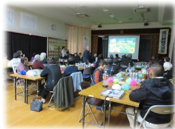
第2期の活動のふりかえり(交流会の際)