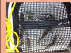
捕獲された イシドンコ 他