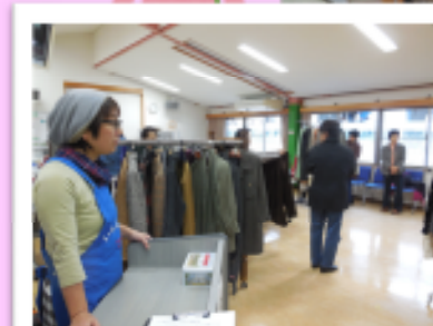
昨年のエコリスフェア『リユースコーナー』