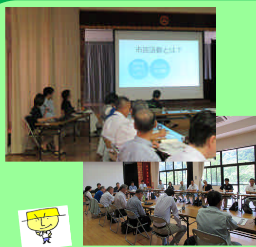
地域魅力化応援隊員の皆さん

「センターは何をしたらいいの？」「具体的に何をやっているの？」を知ってもらう良い機会になりました。合わせて(一部ではありますが)登録団体の活動紹介もさせていただきました。今後、ますます活動への理解と輪が広がって行けばいいなと思います。