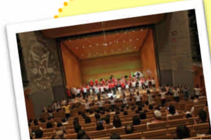
第28回定期演奏会(昨年)の様子。高校生がダンスで演奏会を盛り上げてくれました。

そして、今年も開催します！『益田市民吹奏楽団 第29回定期演奏会』。8月23日(日) 13時30分開演です。演奏曲目は、スラブ行進曲、花燃ゆ、交響組曲『ハリー・ポッター』他。様々な世代の皆様楽しんでいただける曲を準備しています。皆様のお越しをお待ちしています！