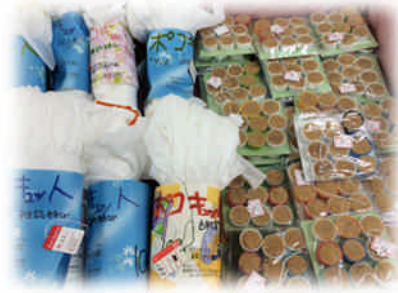
不織布製品や人気のゴキブリだんご！

6月12日から14日まで、キヌヤSCで『趣味の手作りフレンドショップ』が開催されました。本センター登録団体の「こそこそクラブ」「NPO法人息域スペースポコ・ア・ポコ」も出店しました！