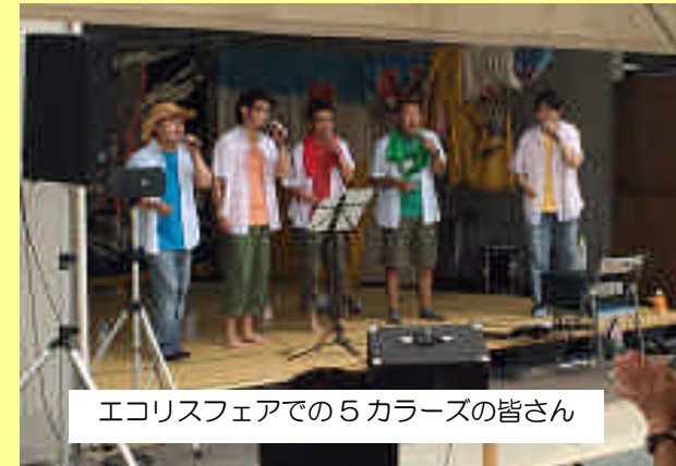
エコリスフェアでの5カラースの皆さん