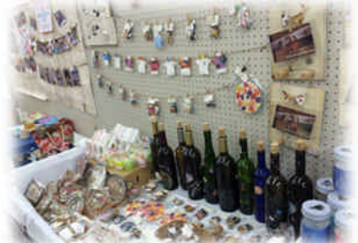
リユース作品の数々！