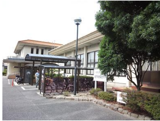
【拠点は益田市総合福祉センター内】