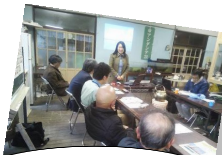
H26.1.30 「アンダンテ21」で行われた「先 進地の学び会」にお邪魔しました。