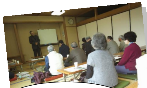
H26.1.14 「益田観光ガイド友の会」の 会議にお邪魔しました。