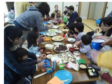
南東北の郷土料理 である「ずんだ餅」も ふるまわれました！