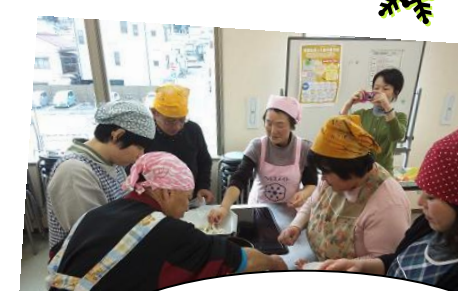
H26.1.15 「息域スペースポコアポコ」の 調理実習に参加しました。