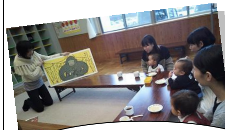
H26.1.21 「とどらあぐるうぶ」の子育て支援 サークルにお邪魔しました。