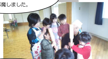
H26.1.25 「STUDIO ダイズ」の菓納豆・ 餅つき大会に参加しました。