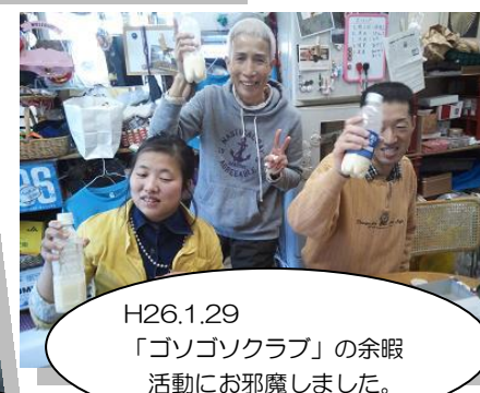
H26.1.29 「ゴソゴソクラブ」の余暇 活動にお邪魔しました。