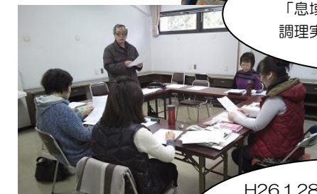
H26.1.28 「石見 SGG クラブ」の研修会 にお邪魔しました。