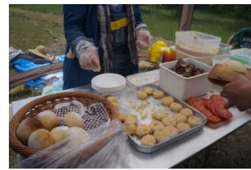
青空の下で食べた スペシャルランチ♪