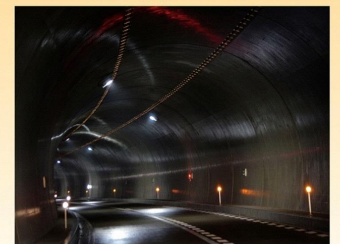
第1回 市長賞受賞作品「ファンタジー」

写真展：平成30年9月21日(金)～23日(日) 場 所：グラントワ 多目的ギャラリー [入場無料] 9:00～17:00 (最終日は16:00まで)