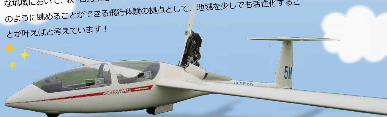
✈ 全長9メートル 翼長22メートル ドイツ製 2人乗り モーターグライダー

益田市には、整備の行き届いた立派な「萩・石見空港」がありますが、東京線の定期便が一日に2便（夏期は大阪線増便）のみと国内でも発着便の少ない空港です。日本海から中国山地に向かって吹く海風のもと安定した上昇気流が発生する絶好な地域において、萩・石見空港を活用し、地元の自然豊かな美しい景色を上空から鳥のように眺めることができる飛行体験の拠点として、地域を少しでも活性化することが叶えばと考えています！