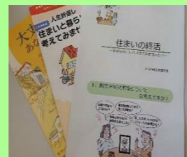
「住まいの終活」資料