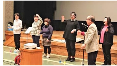
ポコ・ア・ポコさん (歌と手話)