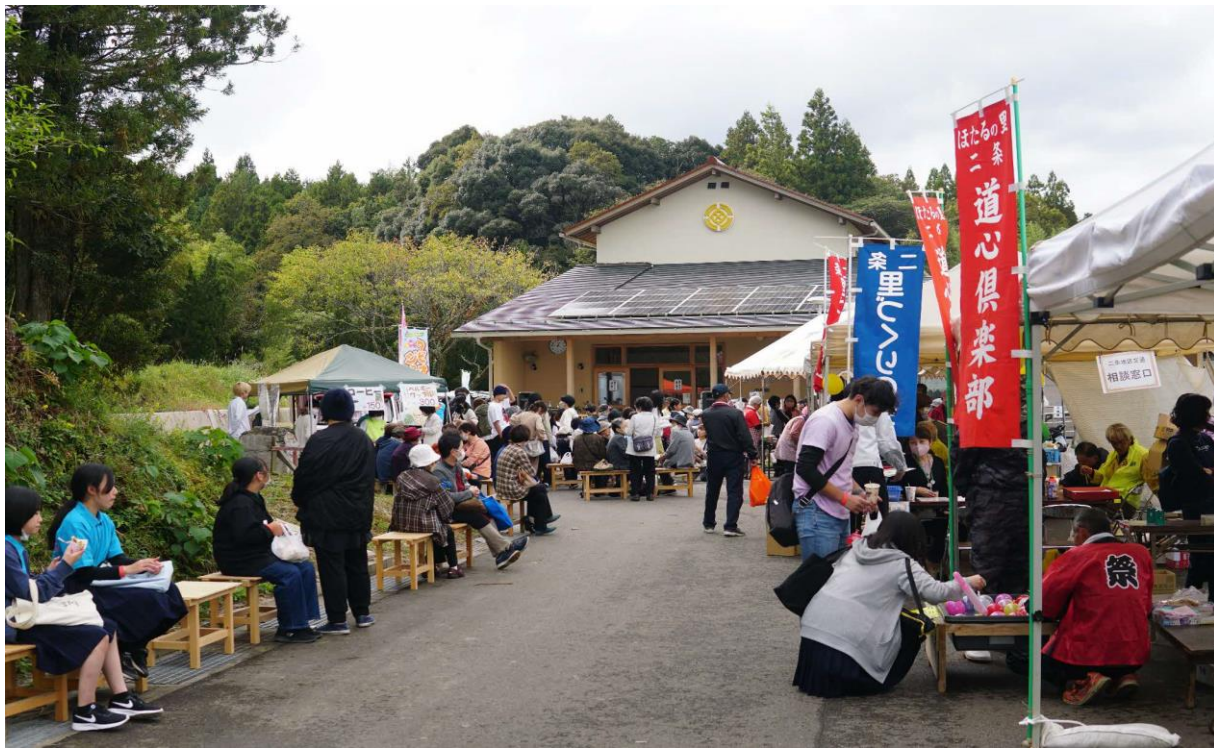
二条ふれあい祭りは地区内外から来た多くの方で盛り上がった