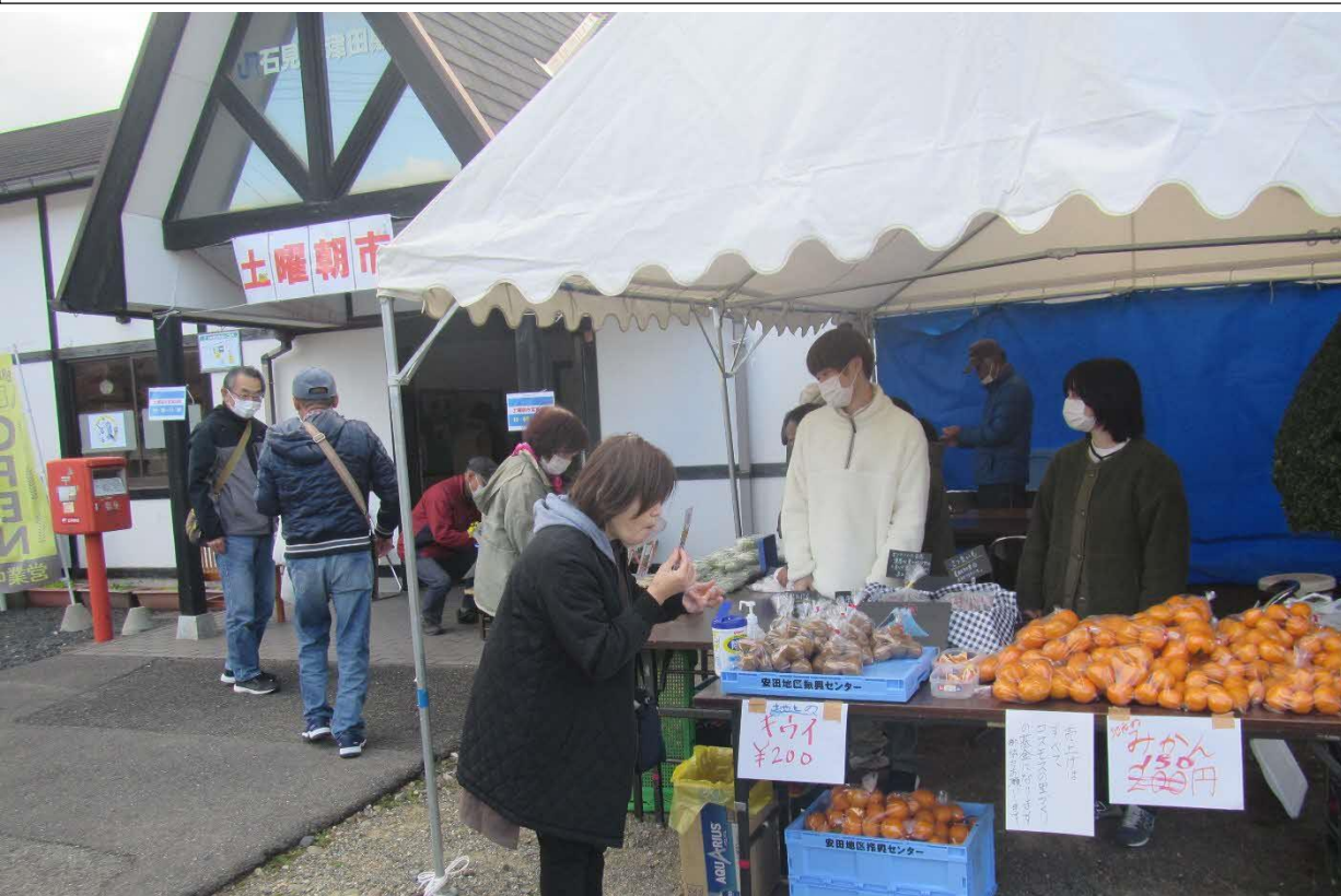
石見津田駅の土曜朝市(毎月第四土曜日開催)