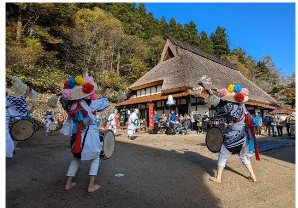
「美濃地屋敷における道川囃子田公演の様子」

地域に受け継がれてきた伝統的な文化や行事などは、有形・無形を問わず様々な形態で継承され、益田の風土をつくりあげています。しかしながら、所有者や継承者の高齢化、人口減少に伴う担い手不足に直面しています。そこで、神楽、踊り、益田糸操り人形などの民俗芸能を伝承する人々、地域の祭りなどの伝統行事を継承する人々の活動を支援していきます。また、次世代に伝えるための人材育成や後継者育成を支援していきます。