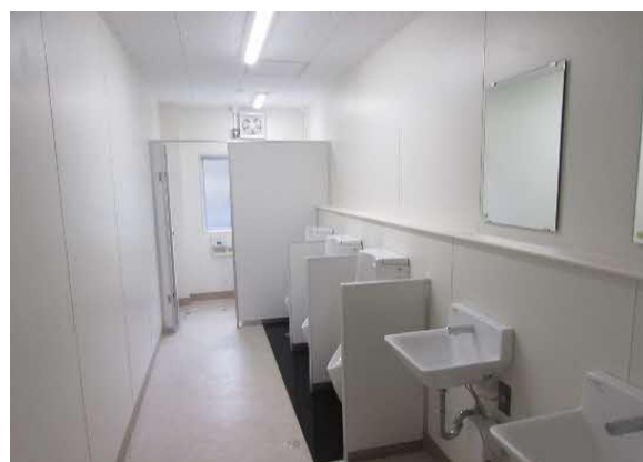
「改修した学校トイレの状況」

学校の施設整備として、市内学校施設の耐震化が完了したことにより、今後は老朽化する施設の長寿命化を進めるとともに、学校トイレの改修や特別教室へのエアコンの追加設置等を計画的に進め、児童生徒にとって良好な教育環境になるよう推進します。