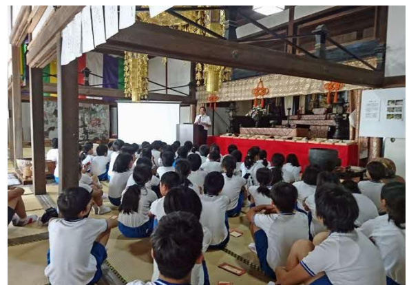
「医光寺での出前授業の様子」

また、学校、家庭や地域と連携して、本市の歴史文化を教材に取り入れることを促し、学校