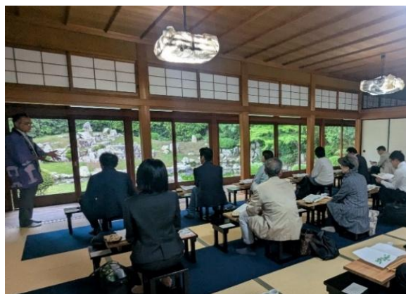
「萬福寺庭園を鑑賞しながらのサムライ御膳」