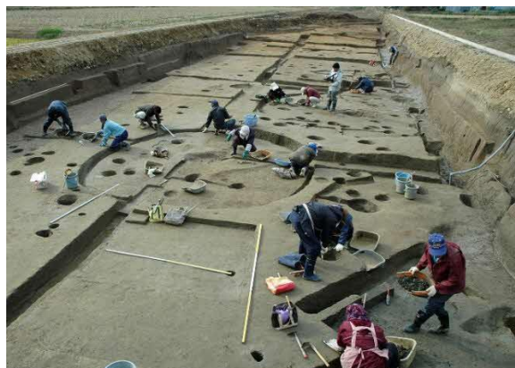
「中小路遺跡の発掘の様子」

日本遺産をはじめとした特色ある中世の文化財のほか、益田には原始から近代までの多種多様な文化遺産があります。これまで価値が十分に認識されていなかったものや見過ごされていた文化遺産なども含め地域の歴史文化の調査研究を進め、その価値や魅力を明らかにし、広く市内外に発信していきます。