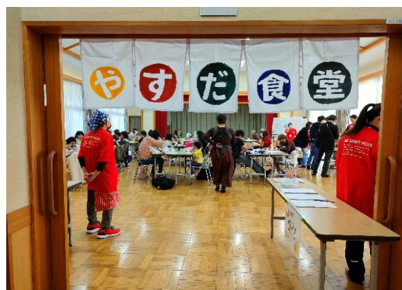
「公民館を中心とした地域活動」

公民館やつらうて子育て協議会、地域の団体などがそれぞれの専門性を活かし、子どもから大人まで多世代が関わる学習プログラムを作成し、学び続け、つながり続ける機会の創出を図ります。また、地域の枠を越え公民館などが連携し、指導者のネットワークの構築等を行い、様々な地域、世代が交流できる機会の創出についても進めます。