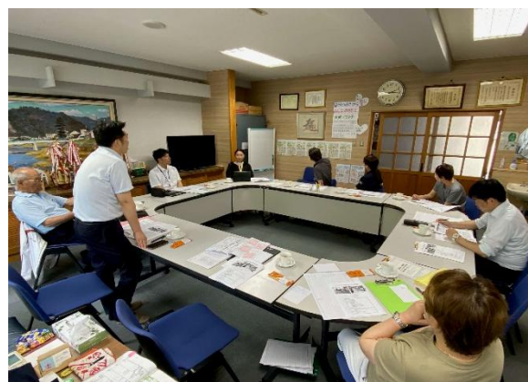
「学校運営協議会の様子」

あわせて、コミュニティ・スクールを設置した学校には、学校運営協議会とつるうて子育て協議会等の連携・協働を進める「ふるさと・ひとつなぎコーディネーター」を配置し、学校と地域の学びをつなぎ、「学校教育」、「地域づくり」、「ひとづくり」を一体的に進め、地域の持続可能な発展を目指します。