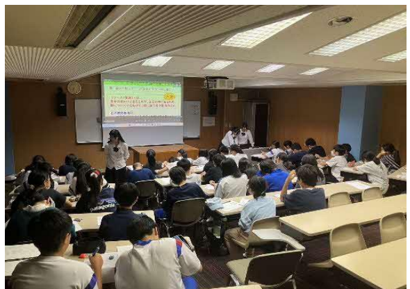
「ドリカム教室の様子」

近年、生産年齢人口の減少、グローバル化の進展や絶え間ない技術革新等により社会構造や雇用環境が大きく、また、急速に変化する予測困難な時代にあって、子どもたちが様々な変化に積極的に向き合い、自らが希望する進路選択を可能とする力を身に付けることが必要となっています。