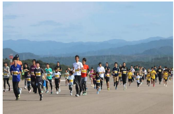
「萩・石見空港マラソン全国大会の様子」

少子化等による学校部活動の縮小や、環境及び社会状況の変化による子どもたちの遊び場や運動機会の減少等により、特に子どもたちが運動・スポーツに親しむ機会が減少しています。