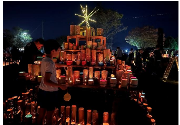
「公民館活動におけるイベントの様子」

各地区の公民館が、「つどう」「まなぶ」「むすぶ」「いかす」という機能を最大限に発揮して「ひとづくり」や地域づくりの拠点となるよう、活動を牽引する人が必要とするスキルの習得をサポートするとともに、地域住民のチャレンジを支援する場づくりを行います。また、各公民館での講座の開催にあたっては、市民ニーズを尊重しつつも、「地域の担い手を育成する」との視点を持ち多様な地域課題に対応した学びの機会を提供します。