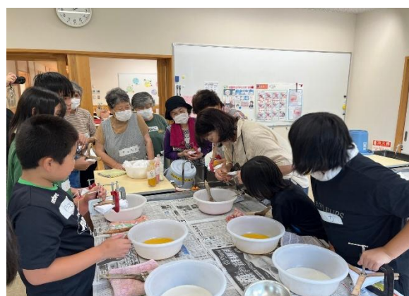
「学校と地域が交流する様子」

・コミュニティ・スクールとなった学校には、「ふるさと・ひとつなぎコーディネーター」を配置し、学校と地域の橋渡し役として、情報共有や活動の調整を行うことで、学校と地域が連携・協働した取組が創出されています。更に地域と学校の連携・協働が効果的に行われるためにも、コーディネーターの配置の充実やつろうて子育て協議会とコミュニティ・スクールによる地域学校協働活動の一層の推進が必要です。