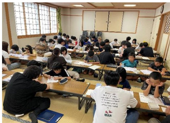
「算数・数学パワーアップ教室の様子」