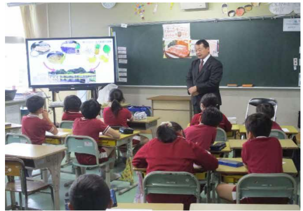
「生産者から直接話を聴く授業の様子」

食育を推進する観点から、栄養教諭などによる小中学校での食に関する指導や、味覚を意識させ、食の楽しみについて学ぶ味覚の授業の開催などにより充実を図ります。さらに、産業の担い手である生産者、生産団体等と連携して田植えや稲刈りを体験したり、食材が提供されるまでの過程を伝えたりすることで人と人とのつながりや自然とのつながりを大切にして、効果的に取り組んでいきます。