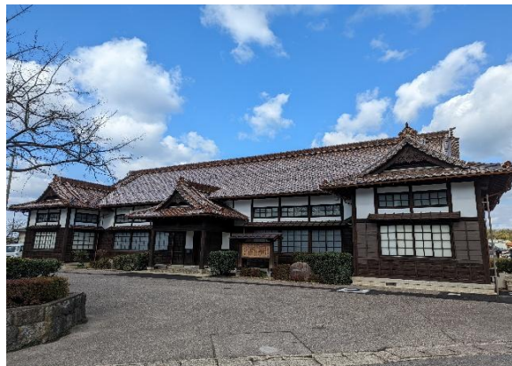
「益田市立歴史文化交流館（れきしーな）」