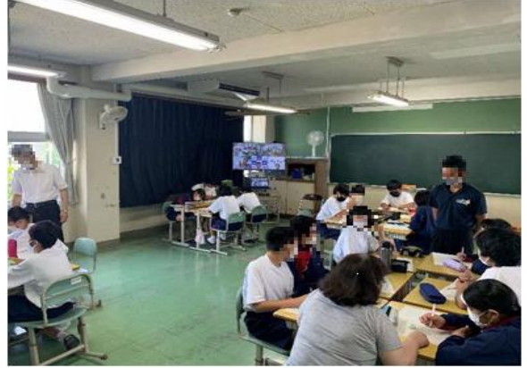
「情報リテラシーの学習風景」

幼小中、家庭、地域、企業及び行政が一体となって進める「益田市情報リテラシー向上推進協議会」において、「情報リテラシーを身につけた子ども」「情報モラルを育む家庭」「インターネットとつながる子どもたちを見守る地域」「安全・安心なインターネット利用環境の構築」を目指します。