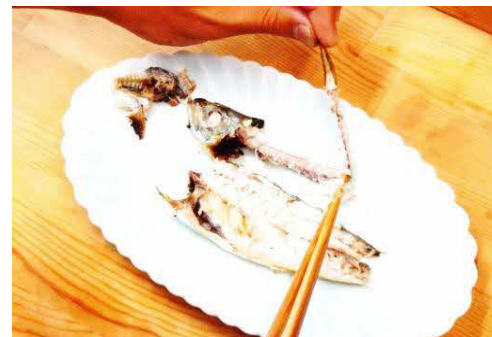
⑥ 骨をお皿の端にまとめる。