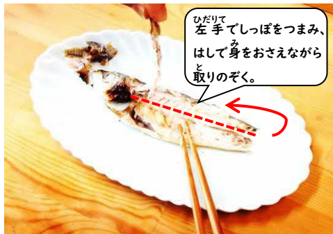
⑤ 背骨と頭を取り除く。