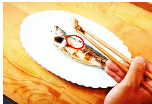
① 背中側の身から食べる。