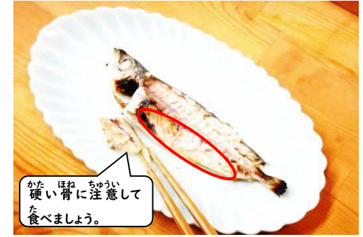
④ お腹側の身を食べる。