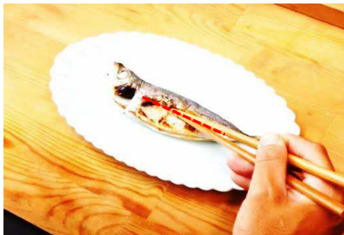
② 魚の中心に切れ目を入れる。