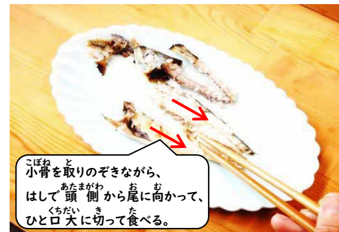
⑦ 下側の身を食べる。