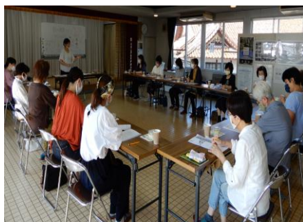
薬膳の魅力を学びました。