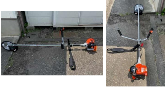
新規購入の刈払機（1台購入）