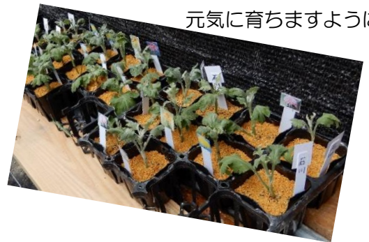
元気に育ちますように