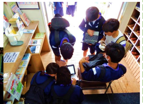
← 館内会議室で昼食をとる様子。