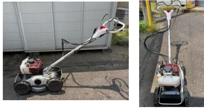
以前からある自走式草刈機