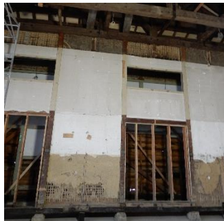
資料がなく工事を始めてみないとわからなかった当時の内部構造。