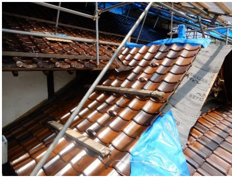
仮屋根の下の新しく葺かれた瓦。当時の製陶技術は、色が安定しなかった為、3色の瓦をランダムに葺いて当時の色ムラを表現しています。

歴史の長いこの建物は、大正10年に「郡役所庁舎」として竣工。その後増築しながら、「益田警察署」「美鹿地方事務所」「益田総合事務所」として活用され、昭和56年に益田市が県から取得。昭和58年「益田市立歴史民俗資料館」として開館します。同年豪雨災害により被災したため、昭和60年に今の場所に曳家工事を行い再オープンし現在に至ります。外観は創建当時から変わっておらず、文化財登録制度の始まった平成8年に「津和野町役場」などとともに県内登録第1号の登録有形文化財となりました。老朽化・耐震性不足などのため、平成31年度から休館していますが、令和5年の春に（仮称）日本遺産ビクターセンターとしてリニューアルオープンする予定です。