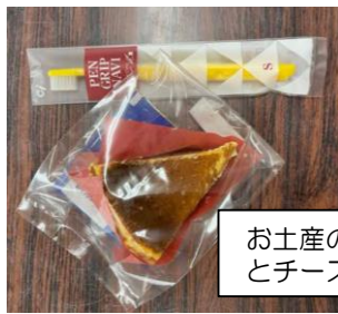
お土産の歯ブラシとチーズケーキ♡