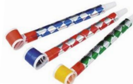
吹き戻しに挑戦する皆さん