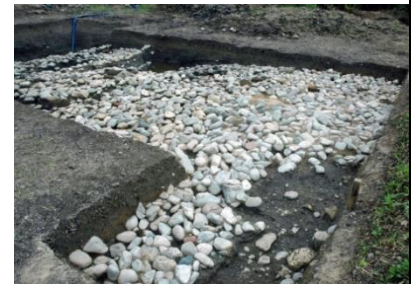
中須東原遺跡の荷揚げ場跡