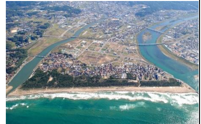
益田平野。手前の日本海に、高津川（右）、益田川（左）が注ぐ。益田川河口の砂州の内側に中世の港町の遺跡（中須東原遺跡）がある。

その威勢は、山城・館の遺跡や城下に見ることができます。東西に 5m の土塁を持つ館・三宅御土居の遺跡、一つの山をまるまる要塞化した山城・七尾城の遺跡は、同規模の領主と比べてはるかに大きく、また後述する特徴的な形をしています。