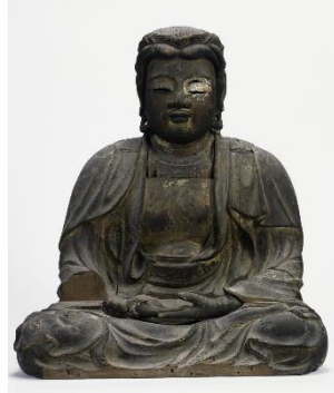
木造釈迦如来坐像(医光寺)