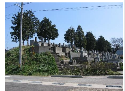
三宅御土居跡。東西約 190m、南北 110mに及び、東西には高さ 5m の土塁が設けられている。