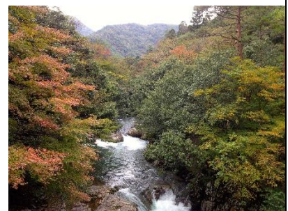
匹見の森林。材木は川下しされ、河口部の港から国内外へと積み出されたと考えられている。