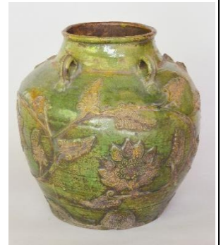
華南三彩壺（萬福寺）