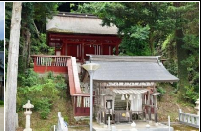
染羽天石勝神社本殿