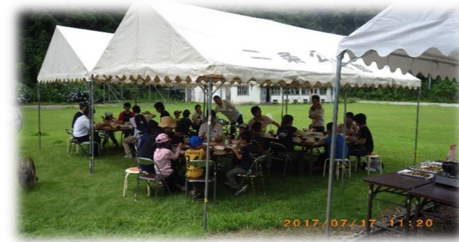
「うん！ 美味しい、ウマイ」