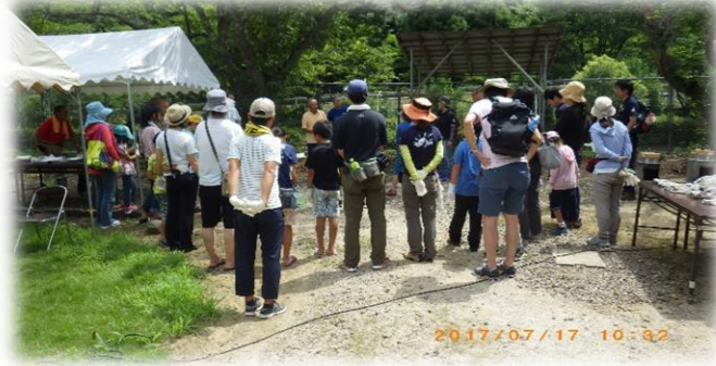
オリエンテーションにて、挨拶！品川会長