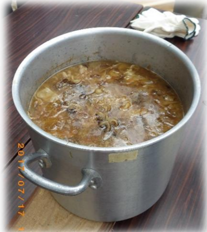
「イノシシ丼」の具、完成～！味は、絶品！