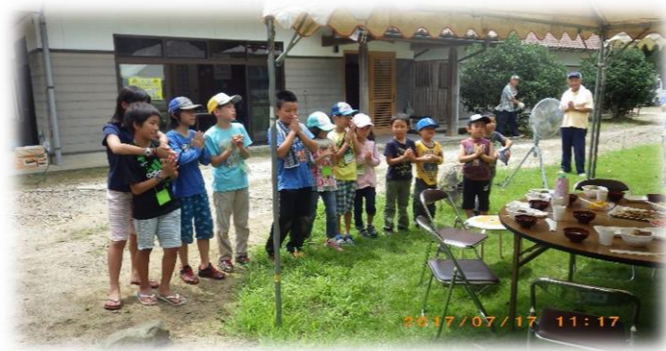
みんなで一緒に、「いただきま～す！」