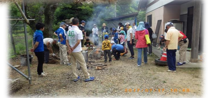
「火付け体験」は、便利と恐怖の両方を味わえる！