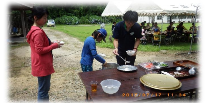
子供ばかりか、大人もおかわり！