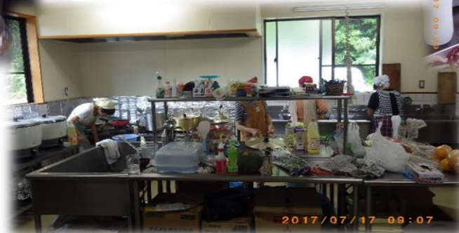
顔が写らない！ 調理4人娘