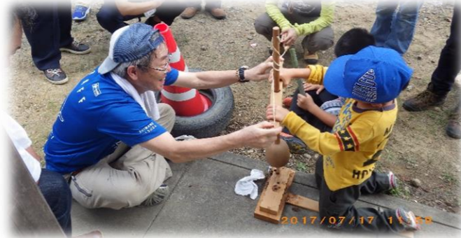
5分以上頑張った、高槻の青帽少年！豊田センター長も奮闘！本物の轆轤鑽にて、「火熾し！」もう少しで着火するところでしたが、残念でした～！