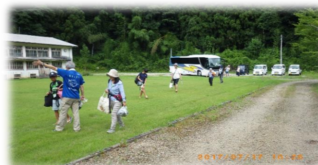
到着！ 案内役は、 センター長