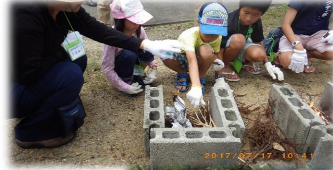
高槻の子は初体験かな!? 「火付け体験」