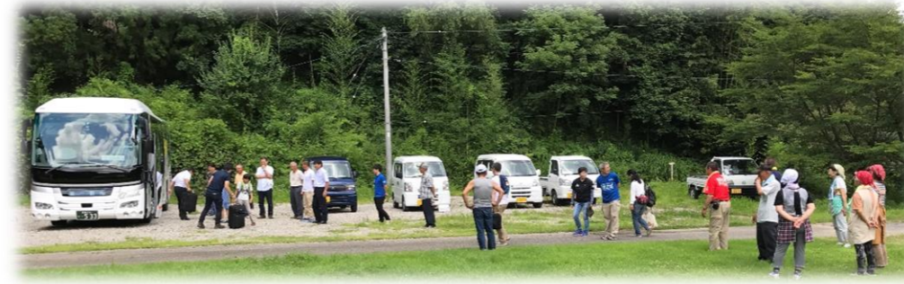
最後の見送り。「またおいでな～！」