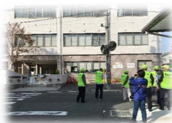
「防災まち歩き」で寄った、松江市立白濁保育所！RC造は殺風景なれど、避難場所としては安心か？