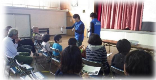
クマの糞に、 一同ビックリ！