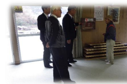
金ヶ峠公民館、設置完了！