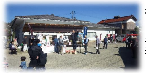
ふるさと祭での福くじ抽選！