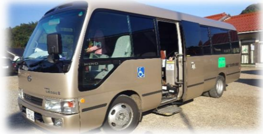
市社協のマイクロにお世話になりました！

中々、町をまたいでまで高齢者が一堂に会するという機会が少ない昨今、家にこもりがちな皆さん、来年も実施されますお出かけバスツアーへどしどしご参加下さいませ！