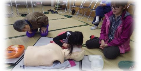
頑張ってるあの子は？