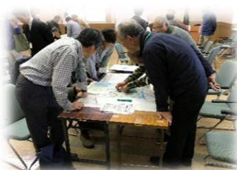
「災害図上訓練（DIG）」の様子！