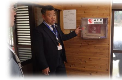
ほたる会館、設置完了！