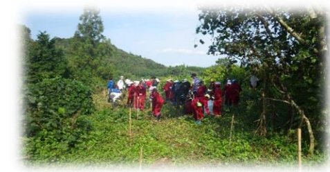
植樹の様子と記念撮影！

この活動も、今年で3年目！森林を守り育てることがいかに大切か、子供と共に大人も学べる、非常に有益な1日でした。