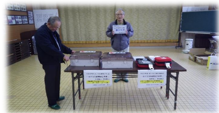
音声ガイダンスとシンプルな操作で、どなたでも扱えます！