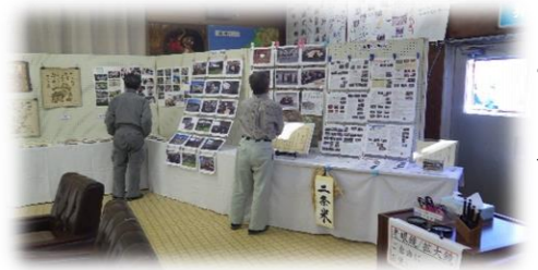
文化祭での本会展示ブース！

皆さんの出店も、早々に売り切れ続出！当日の青空のようすがすがしい日を過ごせた、最高に楽しい1日でした。