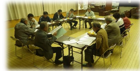
第7回役員会の様子！

10月20日（土） 第3回 なりわい部会 10月24日（水） 第2回 くらし部会 10月30日（火） 第7回 役員会 12月14日（金） 第8回 役員会