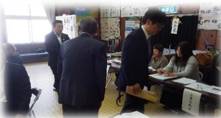
総会終了後、来賓を見送る!