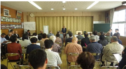
定期総会、始まる! (上写真は、品川会長挨拶の様子)