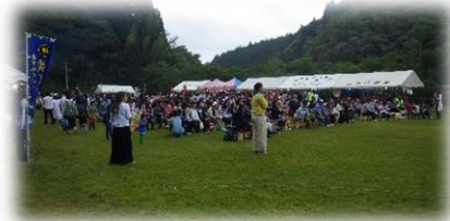
会場を埋め尽くすお客様！

6月5日(水)晩の「ホタル鑑賞会」を経て8日(土)、ほたる会館広場を会場に記念すべき「第30回 二条ホタル祭」が盛大に開催されました。