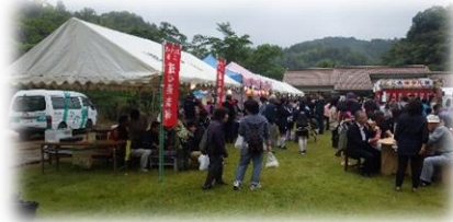
行列の出来るお店!