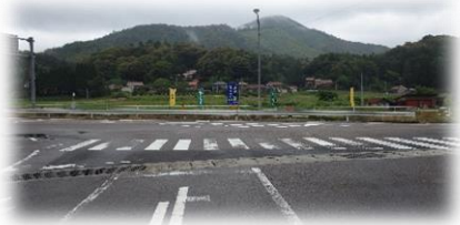
三門商店前交差点(川登町)の案内看板