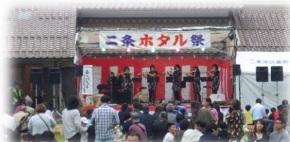
「音のパレット」の皆さん!

ご多間に漏れず人口減少と高齢化にさいなまれている当地区ではありますが、この祭りの時の「地元パワー」を見せつけられると「まだまだ、捨てたもんじゃない!」と思ったのは、私だけではないのではないのでしょうか?