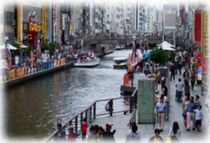
遊歩道の民間活用 (道頓堀川/大阪市)