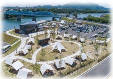
賑わい拠点の整備 (木曾川/美濃加茂市)