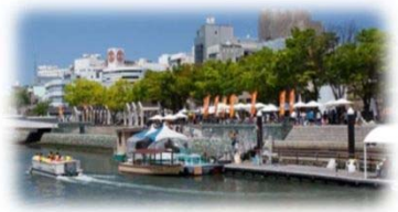
親水護岸の利用 (新町川/徳島市)