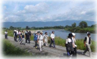
河川管理用通路の利用 (最上川/長井市)