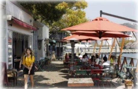
オープンカフェの設置 (京橋川/広島市)