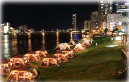
民間事業者の参加 (信濃川/新潟市)