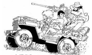
○大塚康生 ○モンキーパンチ/TMS・NTV 原作：モンキーパンチ ○TMS