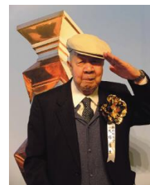
大塚康生 氏 (1931～2021)