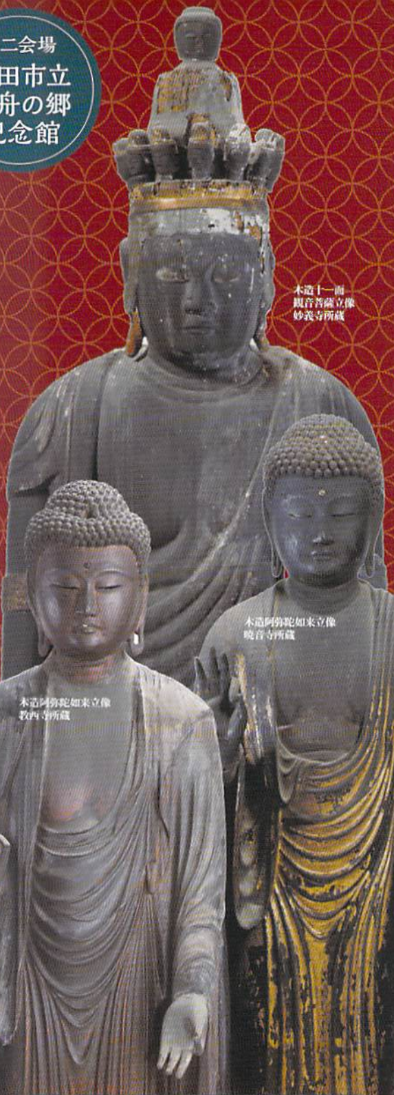
木造十一面 観音菩薩立像 妙義寺所蔵