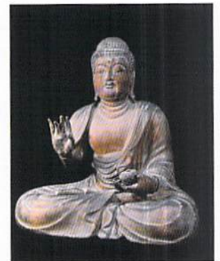
木造薬師如来坐像 東陽庵所蔵

旅行企画実施：全国観光公社 TEL0856-22-1144 FAX0856-22-1141