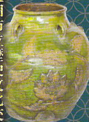
華南三彩貼花文五耳壺 萬福寺所蔵