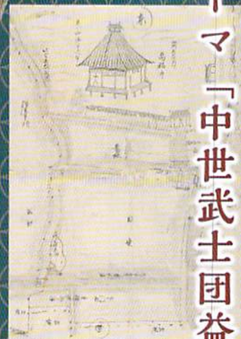
萬福寺境内図 萬福寺所蔵