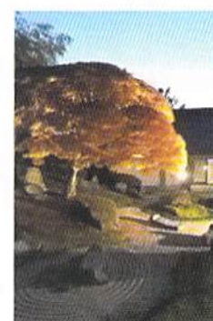
雪舟句遊イベントの様子