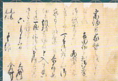
益田元往・全關連署書状 多良木町所蔵