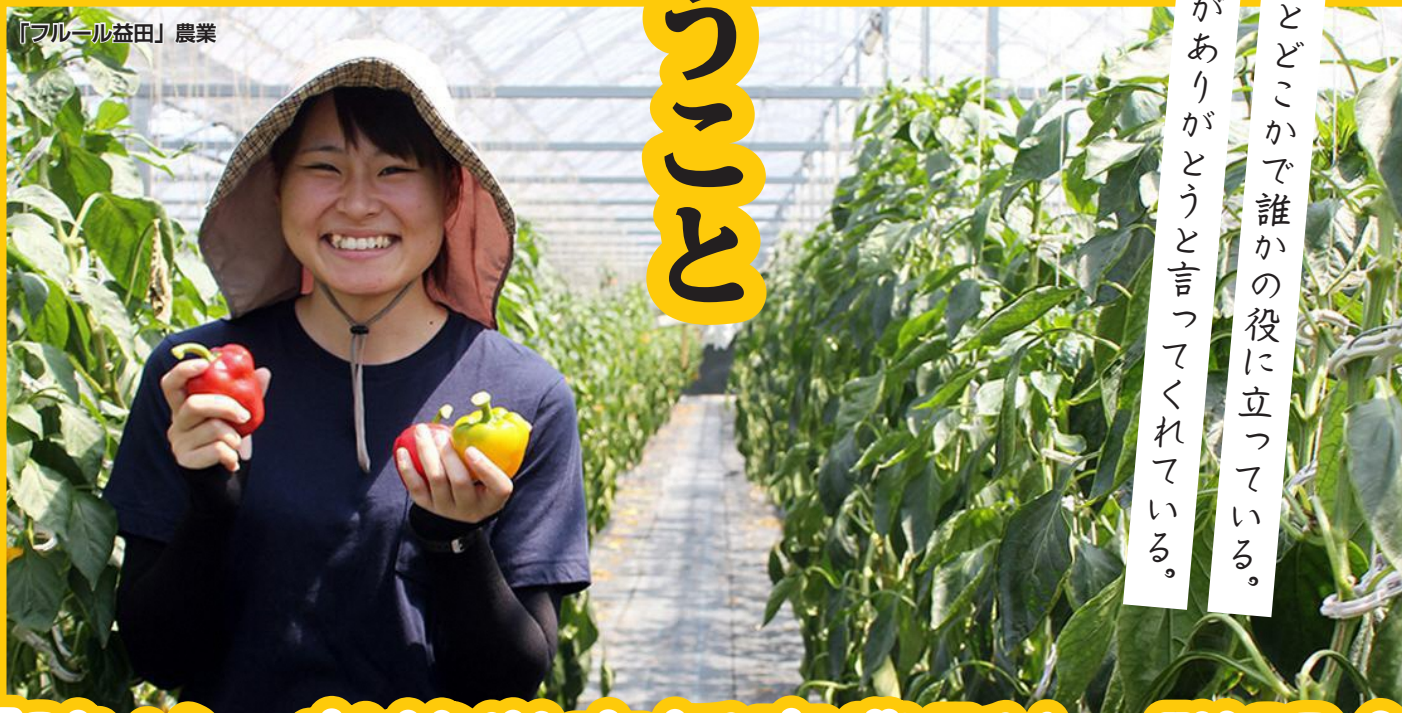
「フルール益田」農業

わたしの仕事は、きつとどこかで誰かの役に立っている。 きつとどこかで、誰かがありがとうと言ってくれている。