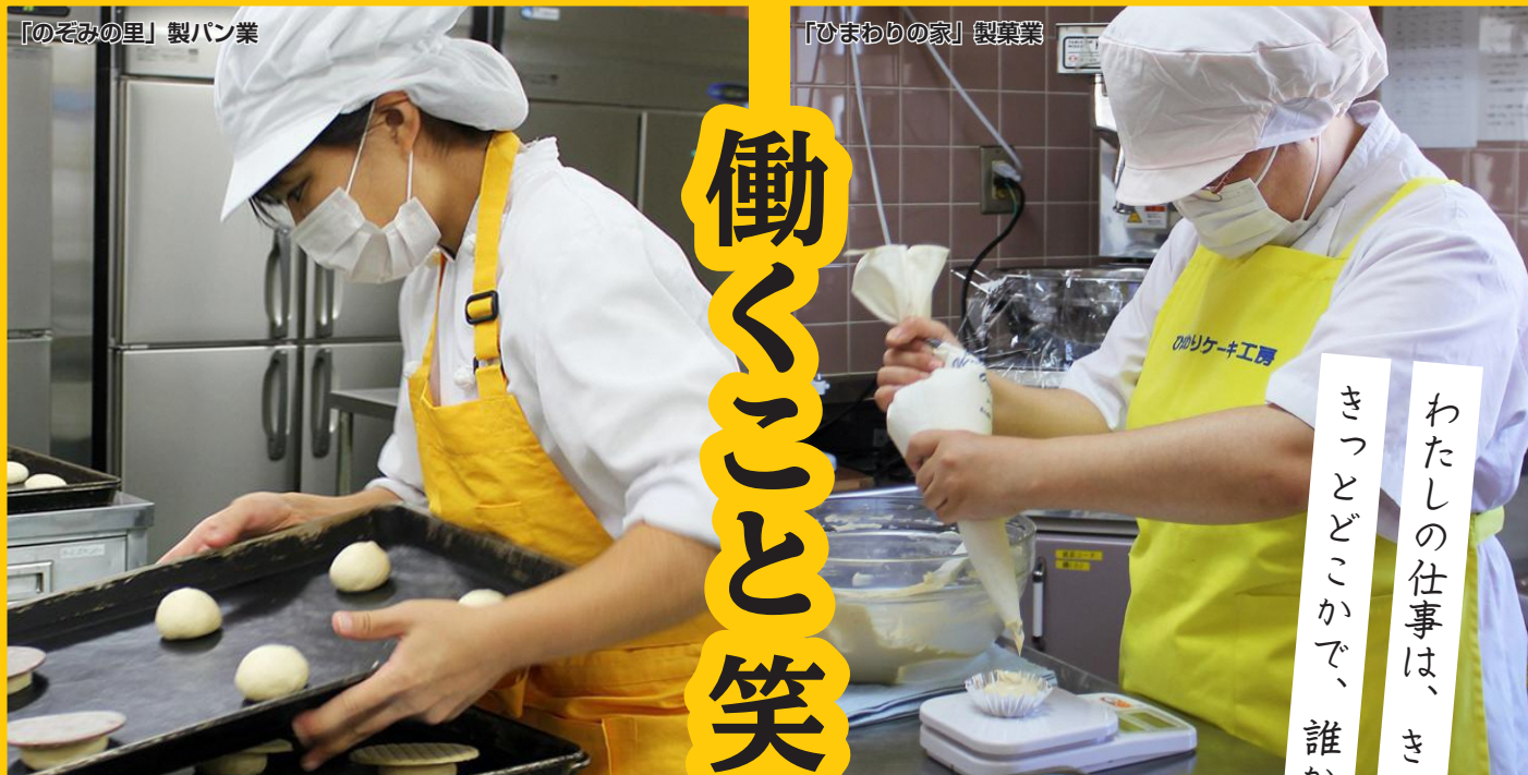
「ひまわりの家」製菓業