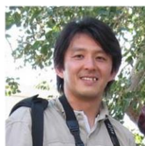
秋野 深 (写真家・執筆家)