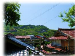
大日霊神社からの景観 (大浜地区)

益田市では、「益田らしい景観」を守り、創出し、次世代につなげていくため、益田市の景観について、市民・事業者・行政がその価値を共有することを目的に、これまで6回の景観シンポジウムを開催してきました。今回は、写真や絵画を通して、身近にある景観を再発見し、景観を楽しむことへの理解を深めるために「身近な景観を見つめ直す」をテーマにシンポジウムを開催します。