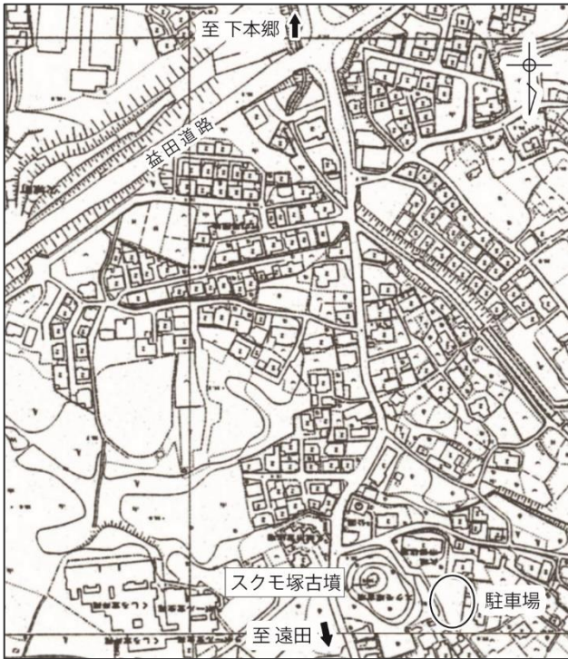
スクモ塚古墳の周辺図