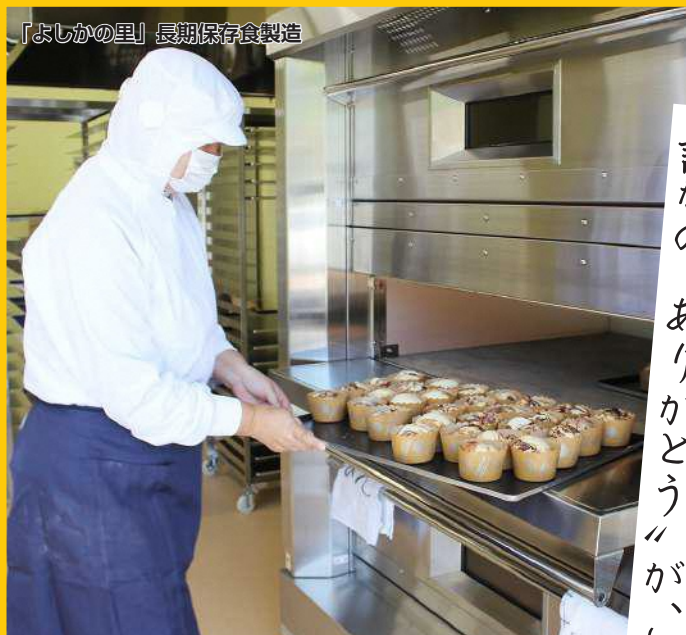
「よしかの里」長期保存食製造

障がい、難病、働きにくさなど様々な困難を抱えている方たちと共に支え合い、社会と関わり働く喜びを得られる地域を目指して！