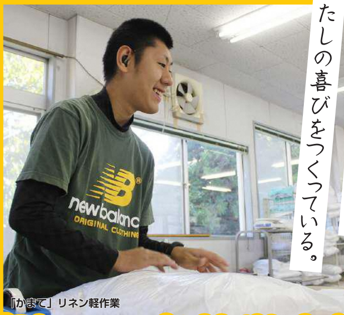
「かまて」リネン軽作業

わたしの仕事は、きっと誰かの喜びをつくっている。 誰かの「ありがとう」が、わたしの喜びをつくっている。