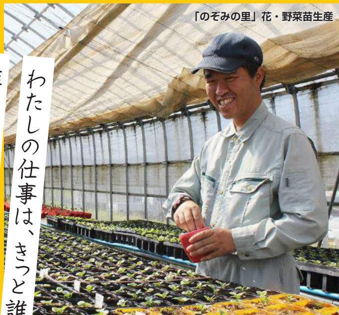
「のぞみの里」花・野菜苗生産

わたしの仕事は、きっと誰かの喜びをつくっている。 誰かの「ありがとう」が、わたしの喜びをつくっている。