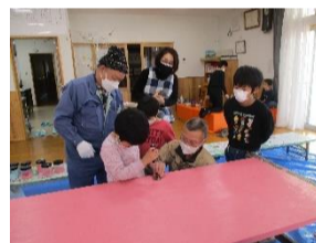
地域の方に教わりながら組み立て！