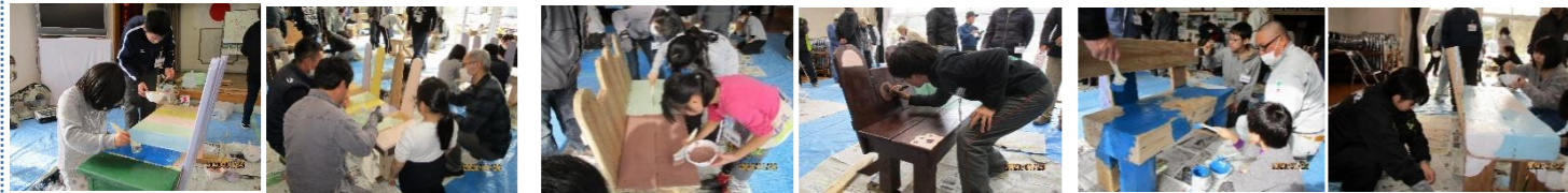
<ピンと伸びた耳がチャームポイント☆> <おめめパッチリ! どっちに座る?> <もくもく雲のすき間には何が見える?>

美濃小学校の廊下の板材や、体育館の梁材を活用した「DIY活動」が1月26日、園児・小中高生元美濃小教諭を含む41人が参加してにぎやかに行われました。(作業量を考慮して、最後の仕上げまでを1日で出来るよう地域の匠5人が事前に梁材などを加工しました)