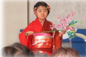
(園児さんの後ろに見えるベンチは、1/26のDIY作品です)