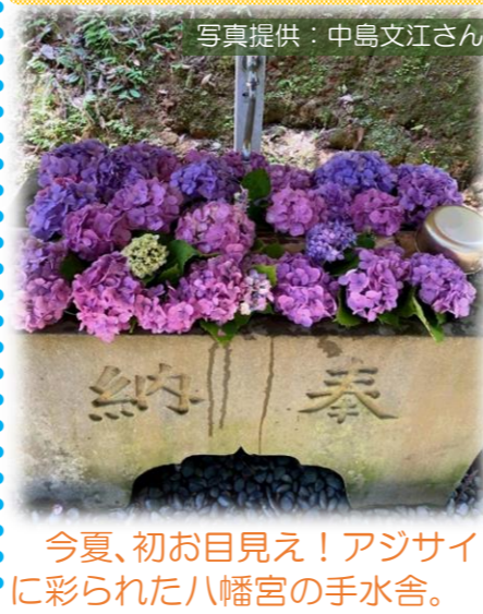
今夏、初お目見え! アジサイに彩られた八幡宮の手水舎。