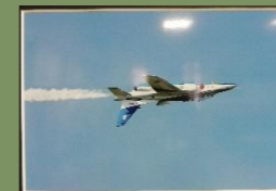
「フォー・ポイント・ロール」