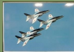
「ファン・ブレイク」