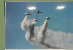
「ダイヤモンド・テイクオフ・ダーティターン」