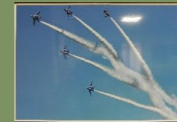
「チェンジ・オーバー・ターン」

※照明が映り込んでしまい、うまくご紹介できず申し訳ありません。ぜひ実物をご覧ください!