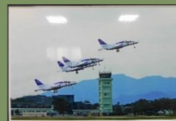
「ダイヤモンド・テイクオフ」