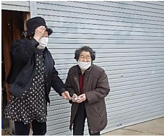
独居者に近況を聞く会員

2月11日、高齢者宅へ安否確認の訪問ボランティアをジャスミンの会が行いました。会員は、朝手作りした桜餅を渡しながら、健康状態や日々の暮らしなどを聞いて回りました。