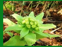
清水の山で見つけたフキノトウ