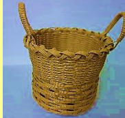
完成した小物入れ