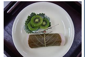
講演後には食推協推進委員さん手作りの「桜餅」でお茶タイム