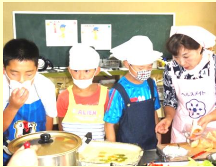
調理の前に説明を受ける3人

夏休みを利用して食づくりを体験しようと、8月23日に美濃地区の小学生を対象に料理教室が美濃公民館で開催されました。