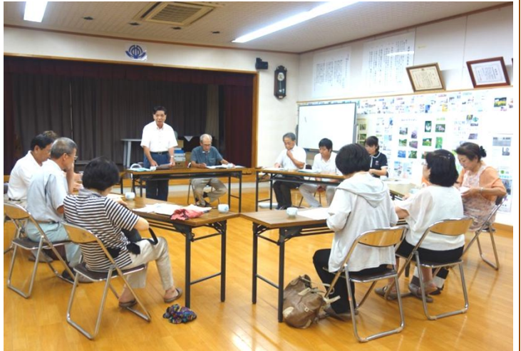
拠点づくりについての討議を重ねる委員

会議では、事前に整備検討部会委員を対象に実施した新施設への要望等の調査結果を踏まえ、施設規模や配置などについて討議が行われました。集会室を兼ねた運動場の規模は緊急の場合の避難所となることも視野に入れ、現状よりも倍程度の広さが必要との意見や、調理室の拡充、地区の子どもと親が集う“子どもスペース”及び図書・談話室の新設などの要望が出されました。この検討部会は、今年度中にあと3回開催される予定となっています。