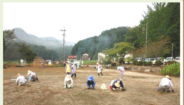
早朝から校庭の整備をする地域の人たち