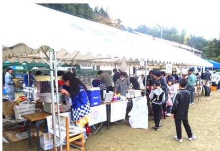
13団体が出店したバザーは売り切れ続出の盛況ぶり