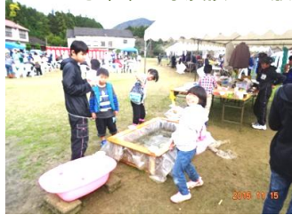
子どもたちに人気を呼んだメダカすくいコーナー