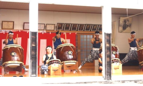
天候不順のため集会室を舞台に迫力ある演奏を披露した“つわの太鼓”

ふれあい祭りに先がけた3日のはつらつ展では、手作り小物やリメイクファッション、陶芸、写真、書、絵画、木工作品、盆栽などに加え、地元の自然を丁寧に撮影した映像、戦後70年に地元出身者が記したシベリア抑留体験記の展示などバラエティーに富んだ作品が並び、来場者の目を楽しませていました。