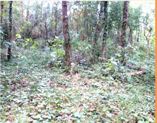
河内小学校が建てられていた跡地(字寺尾)。間口5間、奥行3間の校舎を新築して開校