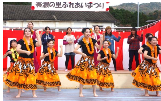
中四国ハワイアン協会宮崎・山尾教室生による華やかな演技と一般参加のワークショップ