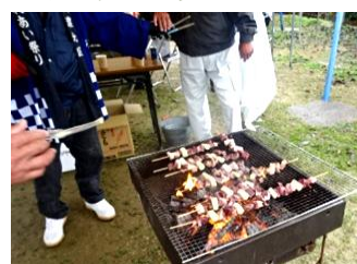
猟友会による地元猪肉の串焼きは百本完売