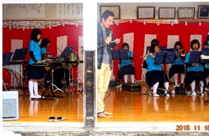
中西中吹奏楽部の演奏に合わせ、地元の人たちが自慢の歌声披露