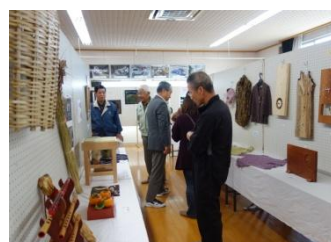
多彩な作品が並びはつらつ展会場