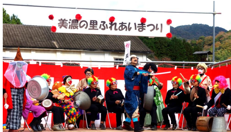
拍手喝采を浴びた地元女性によるユニークな合奏とパフォーマンス

この日に合わせ美濃小の同窓会を開いた人たちもあり、いつもは静かな校庭が人々の笑顔で包まれました。