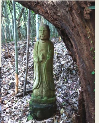
桜の木に抱かれるように立つ高さ約1丈の地蔵尊。桜の開花時の眺めは見事だったという