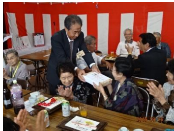
景品が当たるごとに、会場から歓声上がる

また恒例のくじ引きでは、地元有志から多数の賞品提供があったことから、次々に賞品が当たるなど、秋の1日が和やかムードに包まれました。