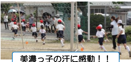
美濃っ子の汗に感動!!