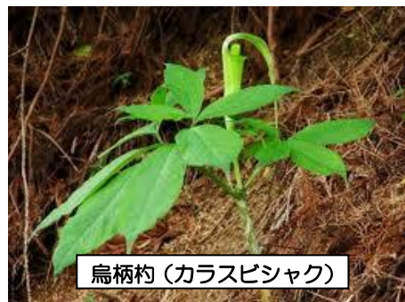
烏柄杓(カラスビシャク)

7月2日は二十四節気の半夏生(はんげしょう)と呼ばれ、梅雨の末期で半夏(烏柄杓<カラスビシャク>)という毒草(生薬にもなる)が生える多湿で不順な頃とされています。また、ハンゲショウ(カタシログサ)という草の葉が名前の通り半分白くなって化粧しているようになる頃との説もあります。地方によっては農家の人達はこの日には一切の農作業をしないようにという戒めになっているようです。また、三重県の熊野や志摩地方では、ハンゲという妖怪が徘徊するという言い伝えがあります。半夏生の頃には、天から毒気が降るとか、地面が陰毒を含んで毒草が生えるなどという言い伝えがあり、この時季に筍・わらびなどを食べることや種を撒くことを忌む風習があったそうです。井戸にも蓋をしたそうですよ。とにかく、時期的に食中毒の危険が高まり、体調も崩しやすいので健康管理に注意することが肝心です。