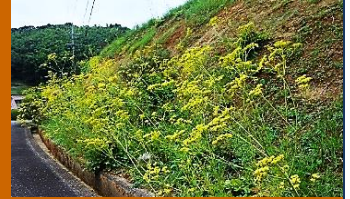
オミナエシの群生(河内)

世帯数 154世帯 人口 344人 男 157人 女 187人 高齢化率 50.0% (8月末現在)