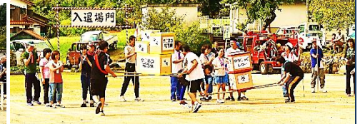
優勝の本郷下自治会