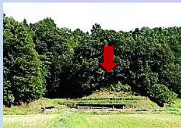
元は円形だった小丘