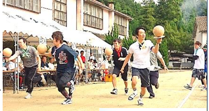
今年の新競技「ウェイトレスリレー」

雨天で28、29年が中止になったふれあい運動会が9月16日、180人参加してにぎやかに行われました。今年はおよそほとんどの種目が新しく塗り替えられ、益田市消防団美濃分団による消防操法も披露されるなど、10月から解体予定の元美濃小学校舎や屋体の建物をバックに、地元出身者も参加して和やかに繰り広げられました。総合優勝したのは本郷下自治会、準優勝は有田上自治会でした。