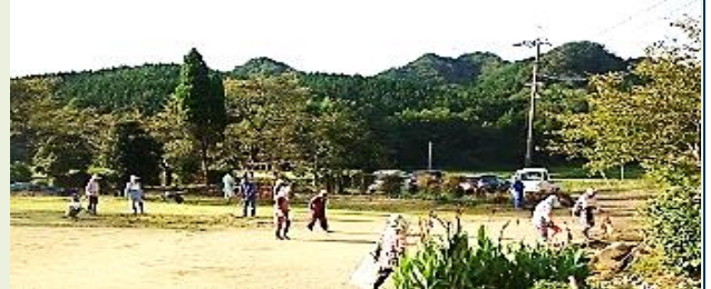
隅々まできれいに整備された校庭

いきいきクラブと連自治会共催の第2回環境整備作業が9月11日に行われました。参加した地区の人たち31人は、いこいの広場と校庭及び周辺の草刈りや草取りなどに約2時間汗を流し、隅々まできれいに整備されました。参加者は「すっきりしたね」と話していました。