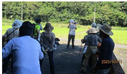
② 阿弥陀如来立像跡地