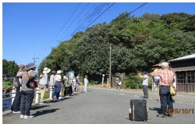
① 美濃地天神山天満宮下

10月11日、24名が参加して第2回となる健康教室が行われました。市健康増進課、山根主任から「知っているようで知らない睡眠のこと」の講座を聞いた後に、益田版益マス元気体操で準備体操をし、自治組織・結い学び部会員による歴史ガイドを聞きながら美濃地区の史跡について学びました。今回は、昨年の試掘調査で陶磁器が発見された城九郎地区をまわり、中世の時代に思いをはせながらのウォークとなりました。