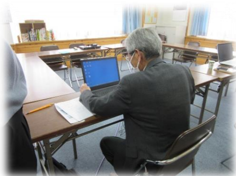
「パソコンを習う方」

4月17日(金) 公民館でパソコン教室を開催しました。当日は10名の方が参加され、パソコンやスマートフォンの使い方等について指導を受け、困りごとを解決しました。 次回は6月19日(金)に開催予定です。詳細は6月号の「おのつうしん」でお知らせいたします。 お気軽にお越しください。