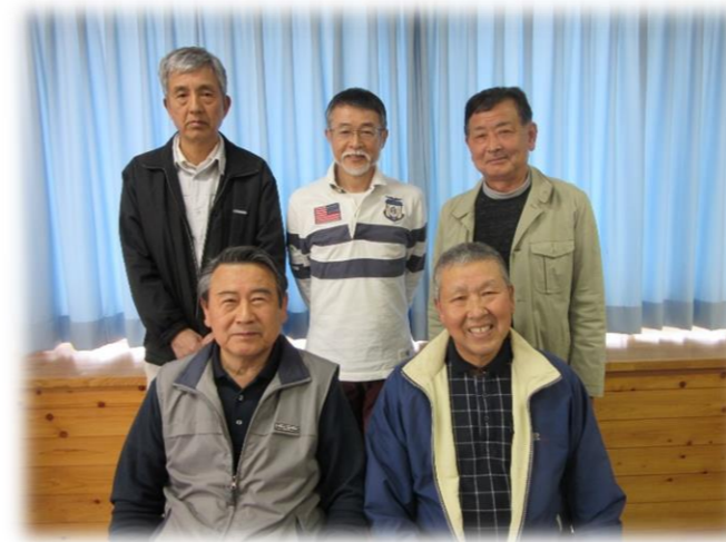
写真は自治会長のみ掲載