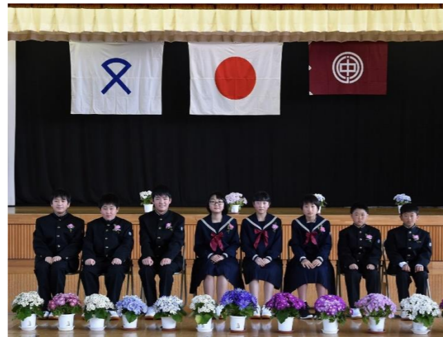
「小野中学校入学式」