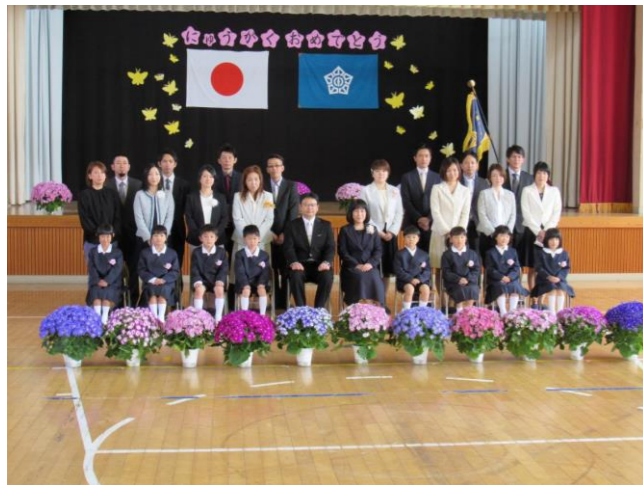
「戸田小学校入学式」

4月9日(木) 戸田小学校で8名、小野中学校で8名の児童・生徒の入学式が行われました。緊張の中にも笑顔を見せ希望に胸ふくらむ式典となりました。 楽しい学校生活ができることをお祈りします。