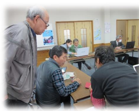
「お互いに教え合いながら…」