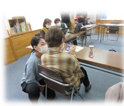
「スマートフォンを習う方」