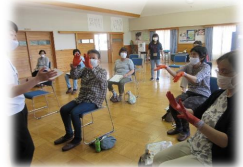
【手に絵の具を塗って手洗い指導と体験】