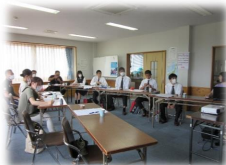
【小野地区の概要を紹介】

カメラを高校生に任せて撮ってもらった写真【岩場の友達と自分の足】勝手にタイトルをつけました