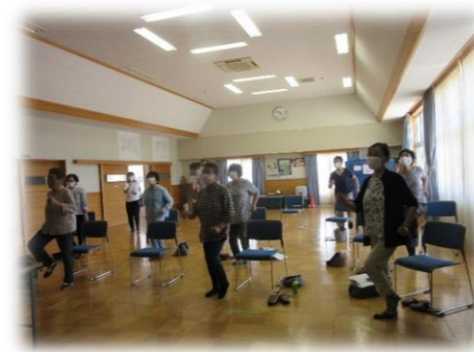
【体力測定の1つ開眼片足立ち 左右で180秒ずつ行いました。】