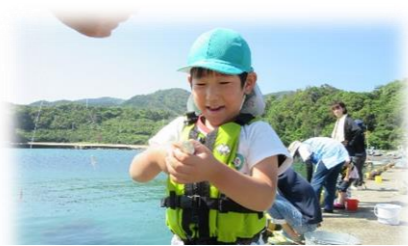
【釣った魚を捕まえて早くバケツへ入れないと…の前に写真を撮らせてね】