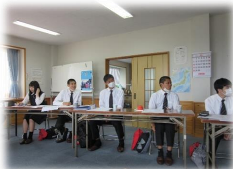
【今年のメンバーは男子4人女子1人】

今年も明誠高校のキャリアサポート教育が各公民館にて行われます。小野地区において昨年は歴史探訪ウォーキング及び産直市の時に「高校生によるダンスの披露とビンゴ大会」が行われました。今年の活動は何をするのか？これから協議し決めます。そのための第1回会議が6月3日（水）に行われました。会議の後は小野地区散策（小浜漁港）も行いました。次回の会議は7月8日（水）に行う予定です。