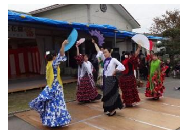
中西の芸達者が勢ぞろい