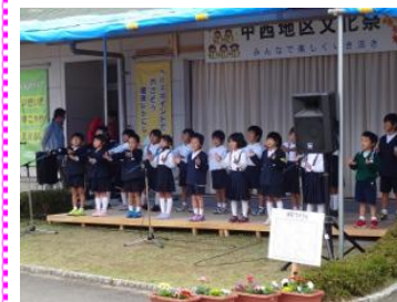
小学校児童の合奏や合唱