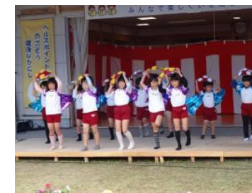
園児のかわいいお遊戯