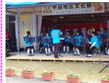
中学校吹奏楽部の演奏