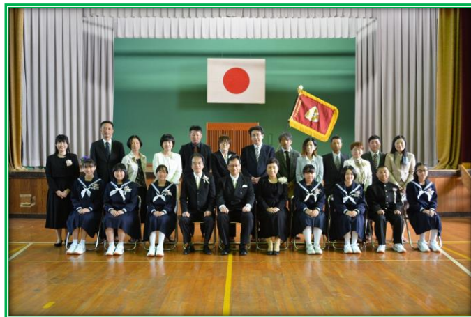
～ 美都中学校 ～

★ピカピカの新一年生！ 4月9日、町内の小学校で入学式が行われました。東山道小学校に3名、都茂小学校に7名、計10名の可愛いピカピカの新一年生が入学しました。 そして同日、美都中学校にも、10名の新一年生が入学しました。