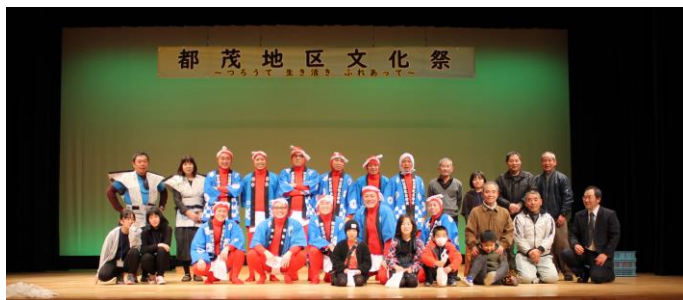
～都茂地区文化祭にて～

「もてなす都茂心」通称“もてつも”は、都茂地区の20～50代の若者で結成したグループです。年々、地域の若者が県外へ流出し、寂しくなっていく都茂地区を元気にしようと2018年2月に有志で結成しました。現在は約20名が賛同し、都茂地区内の自治会長と話し合いを行い、「おもてなし」をキーワードに地域課題の解決に向けて地域と一緒に取り組んでいます。これまで、昨年10月の都茂・島山八幡宮の秋の例大祭に仁輪加勢に参加したり、都茂地区文化祭や金谷城山桜まつりのイベントにも参加しました。私たちのトレードマークは何と言っても真っ赤な全身タイツに法被、ふんどし姿です。活動を通して、都茂地区、そして美都町の元気印となれるよう、地域を盛り上げていきます。