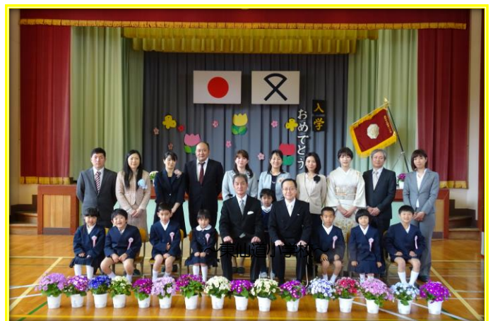
～ 都茂小学校 ～