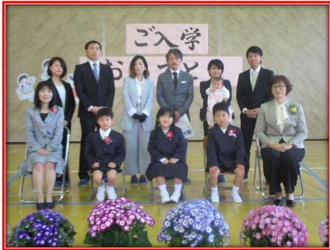
～ 東山道小学校 ～