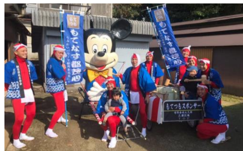
～都茂・島山八幡宮秋の例祭にて～

ふるさと会員への登録や、当情報誌についてのご意見やご要望、または、紹介したいモノや人、グループなどがございましたらぜひお知らせください。なお、ふるさと会員の登録は無料です。お問合せ等は左記電話番号またはメールアドレス chiiki-m@city.masuda.lg.jp まで。