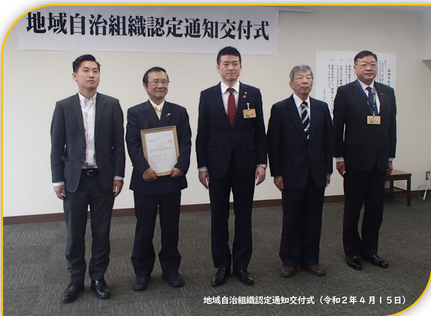
地域自治組織認定通知交付式（令和2年4月15日）