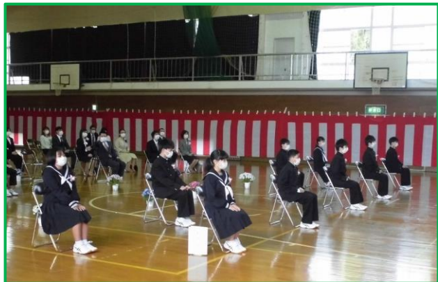
★ 美都中学校 新入生10人 全校生徒 27名