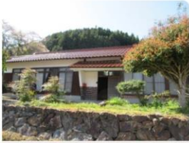
【No.232】 美都・郡茂 山あいの町中にある離れ付平屋建ての一軒家 売買 350万円 New 見学OK

この制度では、空き家を賃貸あるいは売却してもよいと考える所有者と、益田市へのU・Iターン希望者にそれぞれ登録していただき、空き家の情報収集と提供を行っています。