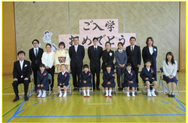
★ 東仙道小学校 新入生6人 全校児童 19名