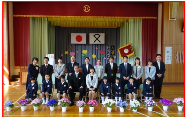
★ 都茂小学校 新入生7人 全校児童 36名