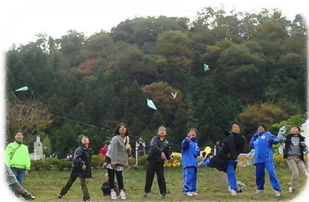
未来に届け、紙飛行機！