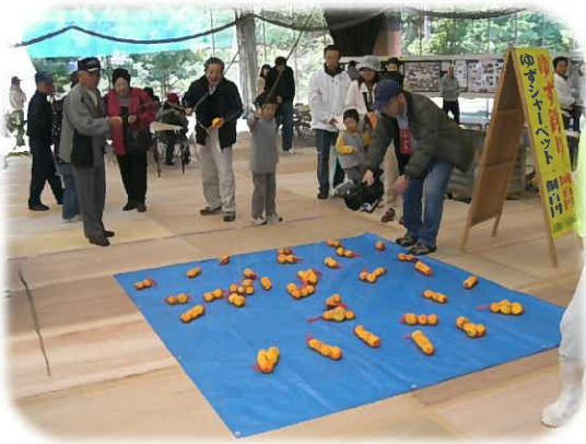
年齢を問わず人気の「ゆず釣り」

このまつりは特産の「ゆず」にこだわったイベントとして開催しており、「みとが奏でるゆず物語」をテーマに「美都温泉ゆず足湯」、「ゆず釣りクイズ」、「ゆずシャーベット無料サービス」などのゆずイベントがありました。