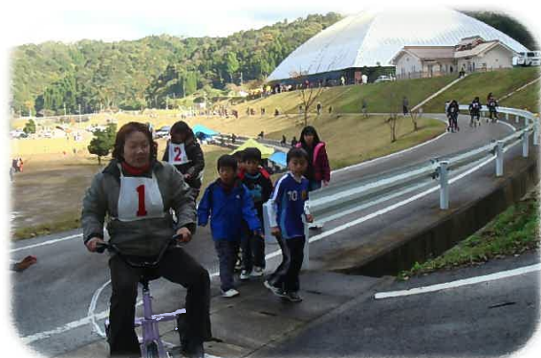
体力と「コツ」が勝負のカギ☆

「美都のええもん市」コーナーでは美都地域の農産物やゆず加工品、地元右田牧場で育った牛肉の販売、町内製造製品の販売が行われました。飲食では猪汁サービスやそばなどの販売が行われました。 また、このまつりにあわせて小学生を対象とした「ゆずっこサッカー交流大会」を開催し、15チーム300名の参加がありました。 ひだまりパークみとグラウンドゴルフ場でも「ふるさとまつりグラウンドゴルフ大会」を開催し、多くの参加者で賑わいました。 その他のイベントとしては、益田川ダム周辺健康ウォーク、紙飛行機飛ばし大会、大型三輪車タイムレースなどがあり、多くの方に「みと」を満喫していただきました。