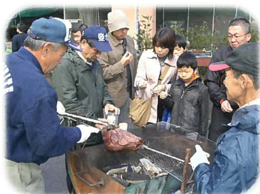
行列のできた「牛肉コーナー」