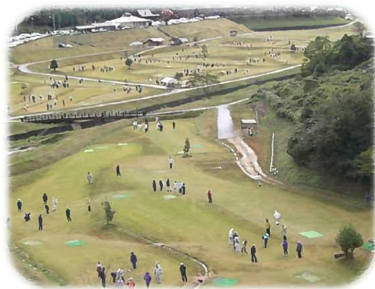
オープン以来最多の参加者

「美都のええもん市」コーナーでは美都地域の農産物やゆず加工品、地元右田牧場で育った牛肉の販売、町内製造製品の販売が行われました。飲食では猪汁サービスやそばなどの販売が行われました。 また、このまつりにあわせて小学生を対象とした「ゆずっこサッカー交流大会」を開催し、15チーム300名の参加がありました。 ひだまりパークみとグラウンドゴルフ場でも「ふるさとまつりグラウンドゴルフ大会」を開催し、多くの参加者で賑わいました。 その他のイベントとしては、益田川ダム周辺健康ウォーク、紙飛行機飛ばし大会、大型三輪車タイムレースなどがあり、多くの方に「みと」を満喫していただきました。