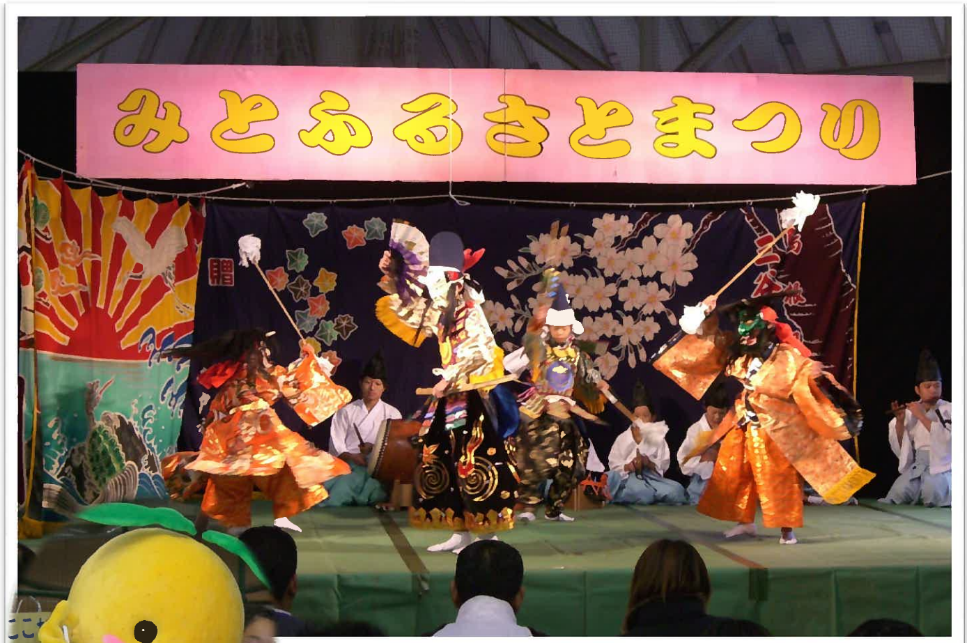
みとふるさとまつり