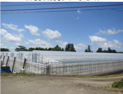
いちご栽培ビニールハウス