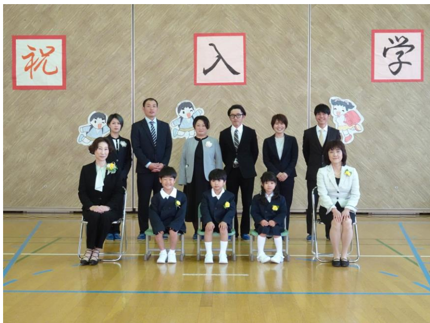
東仙道小学校【全校児童18名】