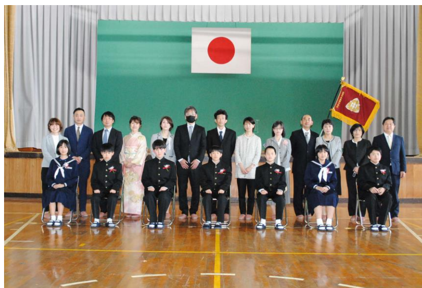
美都中学校【全校生徒21名】