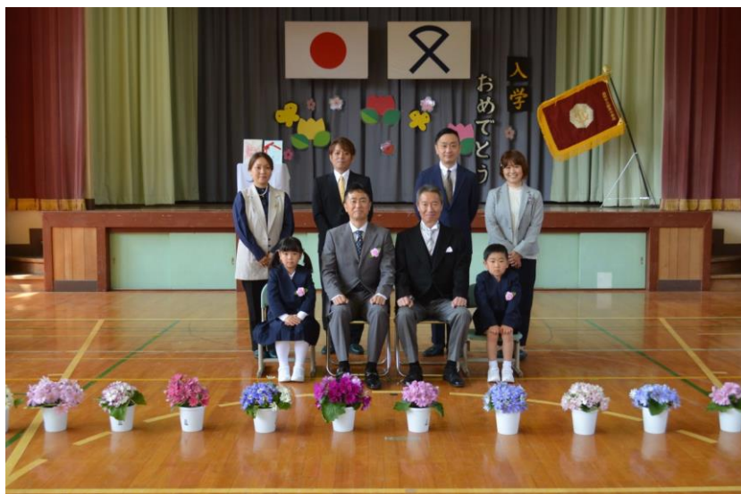
都茂小学校【全校児童26名】