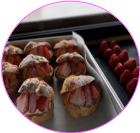
大人気！いちごシュークリーム （※夏は販売していません）

楽しいです。特に農業は自分の性格に合っています。どこまでもこだわれるのがいいですね。キッチンカーもお客さんたちの笑顔を見ると本当に満足できます。