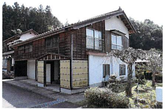
売買価格 200 万円 5K 補修が必要となります

http://akiya.city.masuda.lg.jp/32204_akiya_bank/content.php?id=97