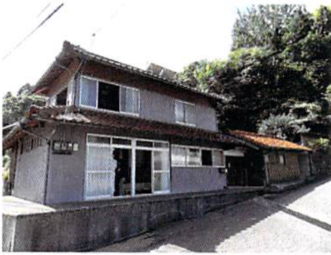
売買価格 200 万円 5LDK 多少の補修が必要となります

http://akiya.city.masuda.lg.jp/32204_akiya_bank/