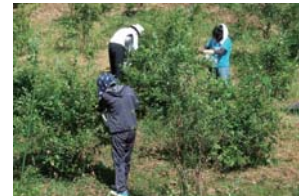
ブルーベリー摘み取り作業

少子高齢化が進む匹見町では、集落内の共同作業やイベント開催などが年々困難になっています。そこで、地域外の方にボランティア会員登録をしていただき、軽度の作業に携わってもらうことで、田舎と都市との交流を図っています。