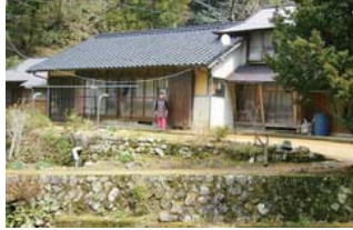
うつだに 農家民泊「内谷とちの郷」

《体験内容》 ものづくり体験（布ぞうり、かご編みなど）、 山菜採り、田舎料理体験、春・秋農業体験など ■宿泊および調理体験料 6,000円 ■益田市匹見町道川イ214 Tel/Fax. 0856-58-0020