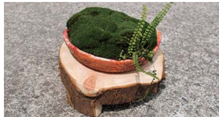
発泡スチロールを加工した植木鉢

「能登店」では作品の展示を行い、いつでもお客さんに入ってもらえるようにしています。 斬新なアイデアや精巧な作り、暮らしを彩るインテリアとしての評判が口コミで広がり、「買いたい！」という声が増えていくとのこと。28年春から本格的に販売するべく、作品の種類や数を増やしています。