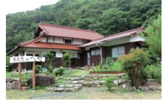
なごうばら 農家民泊「長尾原のへや」

《体験内容》 わさびの苗植え・収穫体験、山菜採り、料理体 験（こんにやく、わさびの醤油漬けなど）、もち つきなど ■宿泊および調理体験料 6,000円 ■益田市匹見町石谷口561 Tel/Fax. 0856-56-0589