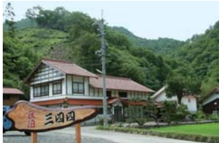
みよし 民泊「三四四」

《体験内容》 ものづくり体験（布ぞうり、かご編みなど）、 山菜採り、田舎料理体験、春・秋農業体験など ■宿泊および調理体験料 6,000円 ■益田市匹見町道川イ214 Tel/Fax. 0856-58-0020